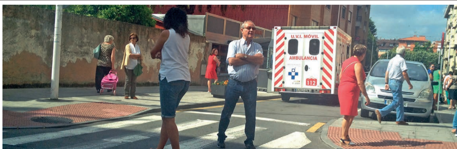
La UVI móvil acudió el 5 de agosto a socorrer a la charcutera en la calle Hermanos González Blanco de Luanco.

El Principado mantiene la plantilla de Candás, pero deja en el aire la de Luanco pese a que hay familias en lista de espera Páginas 2 y 3