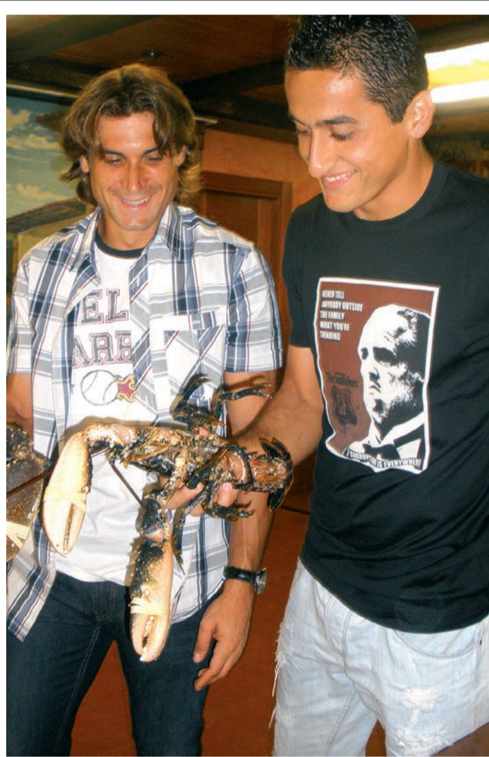
Ferrer y Almagro disputaron la final del Tenis Playa.