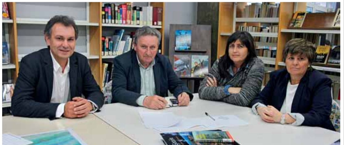
Los políticos de Gozón se encontraron en la biblioteca municipal de Luanco.

Carreño estrenará alcalde en un escenario en el que se incorpora Somos y Ciudadanos • Ramón Artime buscará por primera vez en las urnas el respaldo de Gozón