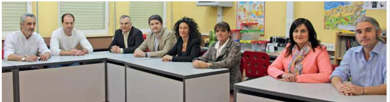
Los ocho candidatos a la alcaldía de Carreño, en una de las aulas del colegio Poeta Antón. (PAULA FERNÁNDEZ)