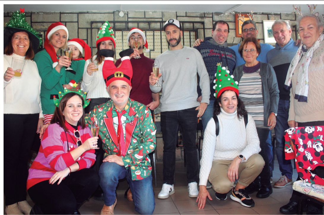
Los asistentes a la Nochebuena de Casa Sandalio brindan por el futuro. Página 27

Los datos no fueron escaneados al ser «muchas páginas», según testificó el funcionario en los tribunales Página 14