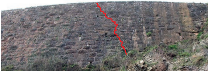
La fisura, horas antes del colapso del muro. Al lado, una reproducción gráfica de la trayectoria. (E. F.)

Un perlorín trató de avisar al alcalde de una grieta de cinco metros en El Tranqueru Página 14