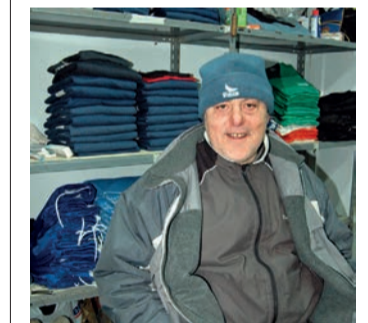
La plantilla ya le echa de menos.