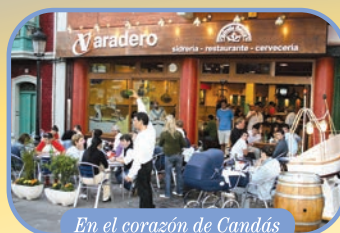
En el corazón de Candás