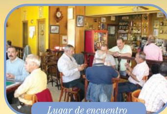
Lugar de encuentro