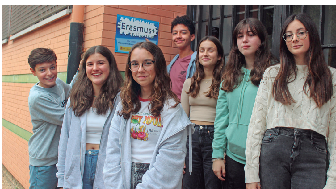
Parte del alumnado que estuvo en Europa del Este en octubre.